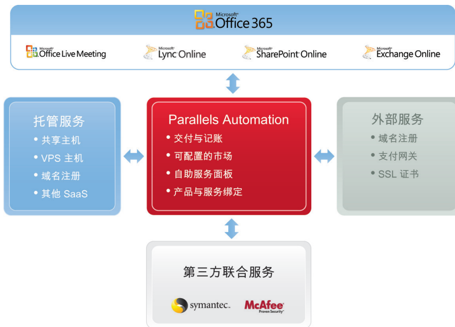
图1.Parallels Automation 简化了多项云服务的交付

在未来 3 年里花费 400 亿把整个信息技术转向云计算（IDC，2010 年 6 月），对于服务商来说这是个绝佳机会，抓住这个转变，与其他关键云计算服务绑定销售 Office 365。但是市场竞争相当激烈，因为互联网巨头、分销商、独立软件开发商、硬件公司、网络供应商以及 IT 领域里几乎所有主要部门都正陆续转入云计算服务方向。因此，抢先推出 Office 365 联合将是成败的关键，因为所有认证的合作伙伴都会在同一起跑线上开始这个项目。